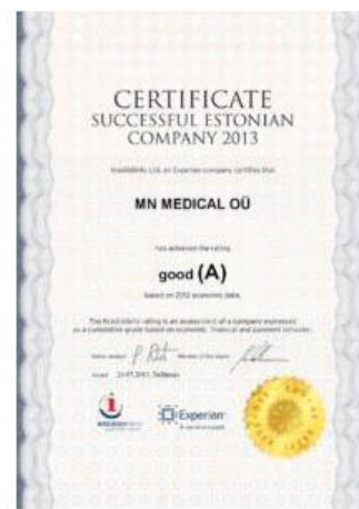
Успешная эстонская компания 2013