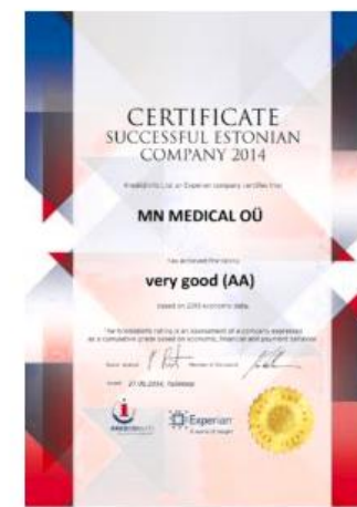
Успешная эстонская компания 2014