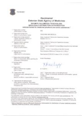
Лицензия оптовой деятельности