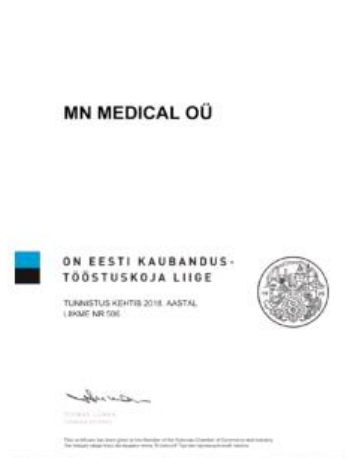
Член Эстонской Торгово- Промышленной палаты