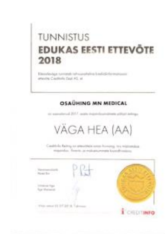
Успешная эстонская компания 2018